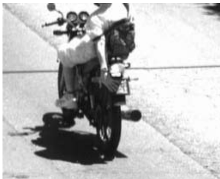
Contorcionismo 2: vale-tudo para não aparecer na foto

Quando os radares começaram a ser instalados, as filmadoras usadas para o registro da infração não eram desenvolvidas para este fim. Utilizavam-se os modelos comuns, o que facilitava muito