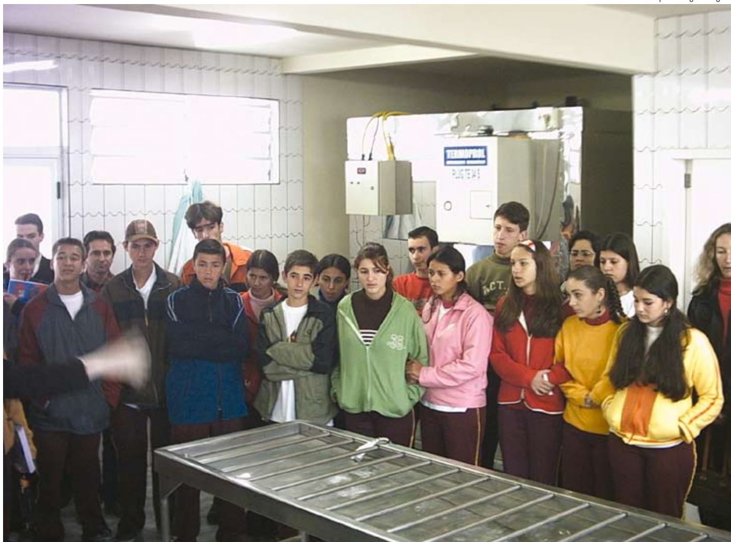
Adolescentes conhecem e assistem aula de segurança no trânsito na sala do IML de Araranguá

O projeto Habilitar para a Vida, do município catarinense de Araranguá, distante 210 km de Florianópolis, adotou uma pedagogia radical para passar a adolescentes entre 15 anos e 17 anos noções de segurança no trânsito: parte das aulas é ministrada no IML (Instituto Médico Legal), onde os alunos podem ver in loco os resultados da imprudência no trânsito.