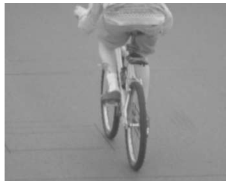
Bicicleta “voa” a 70 km/h; velocidade permitida no local é de 50 km/h