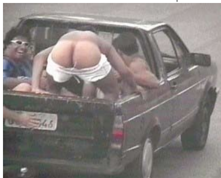
Contorcionismo 1: vale-tudo para aparecer na foto