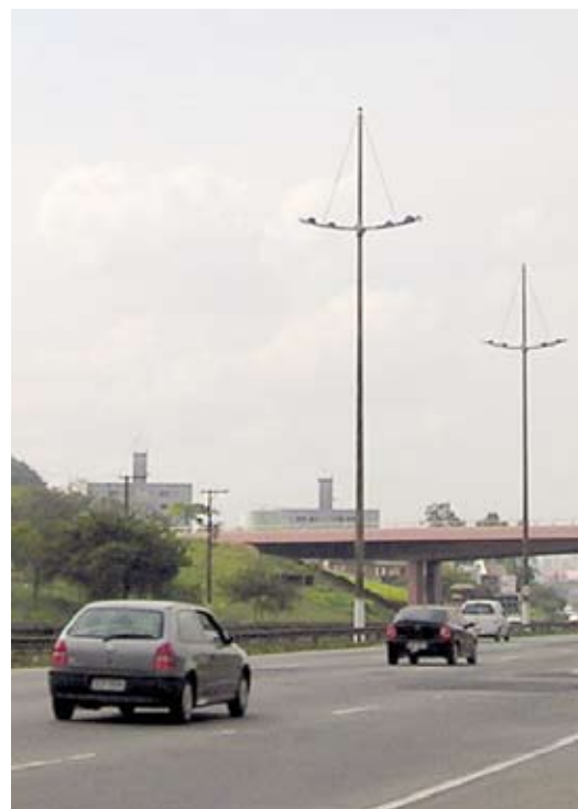
Equipamentos e sinalização na rodovia Imigrantes (SP) ajudam a conter o excesso de

Com a adoção de uma fiscalização de trânsito mais rigorosa, programas educacionais e um sistema de monitoramento mais eficiente, o município paulista reduziu, em 2002/2003, 51,6% o número de vítimas fatais, ou