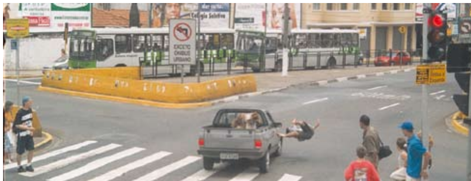
Pedestre atropelado na faixa de segurança por carro que desrespeitou o semáforo vermelho

A miniaturização dos equipamentos e a portabilidade deles tendem a crescer com o passar do tempo. “Não dá para saber se o radar vai chegar ao estado da arte, mas há uma incorporação contínua de novas tecnologias no sistema de fiscalização e monitoramento. Hoje em dia, por exemplo, em alguns lugares há radares com visão panorâmica do trânsito na região”, acrescenta Marques. -