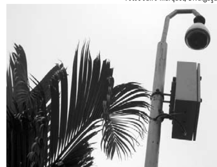
Câmera Speed Domo, que gira 360 graus