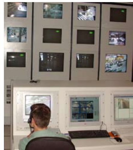
Operador acompanha a movimentação da cidade pela Central