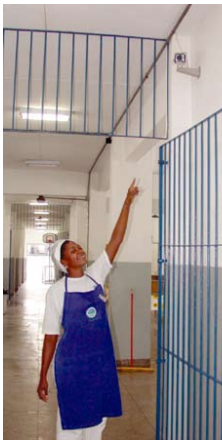
Funcionária mostra câmera fixa em escola

Assim que as câmeras identificam veículos com problemas, o apoio é acionado e o motorista recebe ajuda necessária para fazer a remoção do veículo para um local seguro. Desta